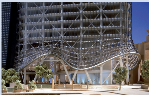
Bishopgate Tower, London

Das Modell stellt im Architekturmodellbau das entscheidende Werkzeug dar. Um ein Projekt wirklichkeitstreu darzustellen, muss das Modell extrem detailliert und maßstabsgetreu gebaut werden. KPF verwendet im Modellbau eine große Anzahl unterschiedlichster Materialien. Papier, Karton, Holz, Furnier und Kunststoffe müssen mit höchster Präzision und Genauigkeit zugeschnitten werden.